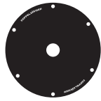
ホイールカバー(B) [凹小：リム右側(ボス)]